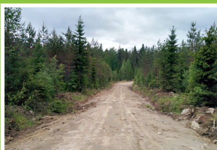
Runkotyöt valmiit kesäkuussa.