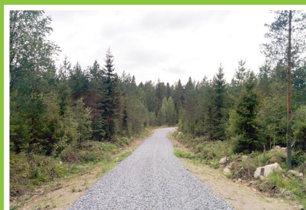
Valmis tie elokuussa